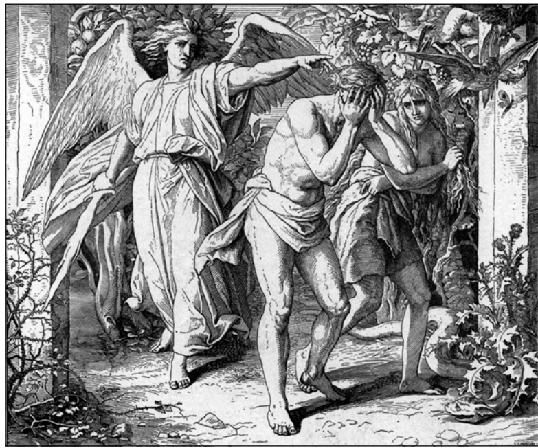
• Изгнание из Рая.

— Что с тобой? Почему ты плачешь? И чужая боль проникала в ее сердце. Вот и теперь она скло-